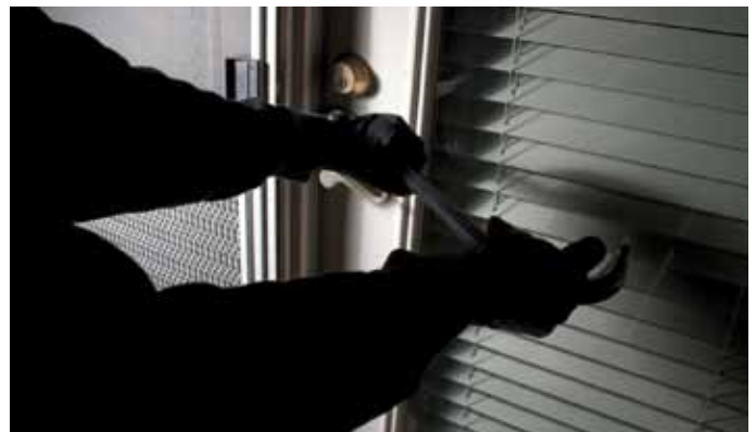
Gelegenheit macht Diebe: Fenster und Terrassentüren sind häufig die Schwachstellen der Einbruchsprävention

Haushalten eher noch die Ausnahme. Geeignete Schutzmechanismen erhöhen die Sicherheit Ihrer Immobilie schon mit geringem Aufwand und bieten wirksamen Schutz vor „ungebetenen Gästen“.